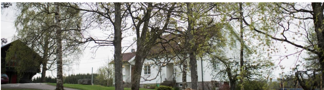
Johnsrud gård - Inn på Tunet

Dagavdelingen på Vilberg Bosenter har fått kr.1000,- i støtte til underholdning.