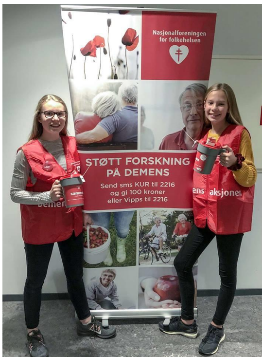
Bilde fra 2018.